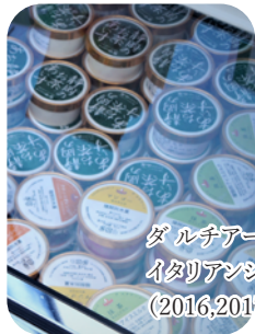
ダ ルチアーノ 堀之内本店 イタリアンジェラート (2016,2017 出店)

野猿街道沿いのジェラート店ダ ルチアーノさん 素材とおいしさにこだわり続ける人気店です 地場産素材の使用にも力を入れています 堀之内 2-16-9 www.da-luciano.com