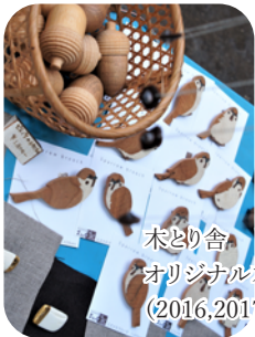
木とり舎 オリジナル木工雑貨 (2016,2017 出店)

野猿街道沿いのジェラート店ダ ルチアーノさん 素材とおいしさにこだわり続ける人気店です 地場産素材の使用にも力を入れています 堀之内 2-16-9 www.da-luciano.com