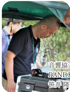
音響協力 PANDKEY STUDIO 笹井 隆さん

京王堀之内駅近くの音楽スタジオの店長さん たくさんのお客様が利用しています マルシェではステージ音響をオペレーション 最高の音響で会場を盛り上げます